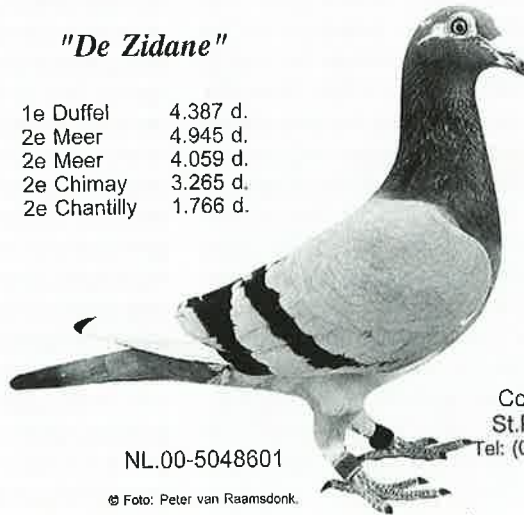
Comb. Bleeker St. Pancras (NL) Tel: (0031) 72-5642869